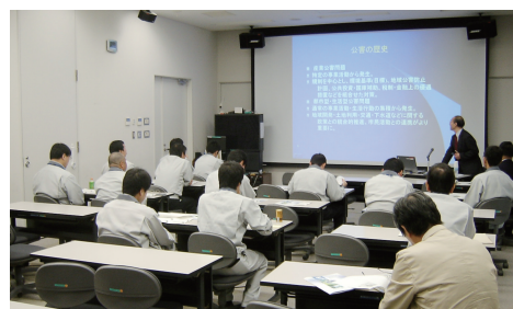
環境配慮活動研修会

2010年度は各拠点に共通的な話題（環境配慮促進法、環境配慮活動概論、事例紹介）のほかに拠点毎の独自課題や、環境マネジメントシステムについても話題としました。